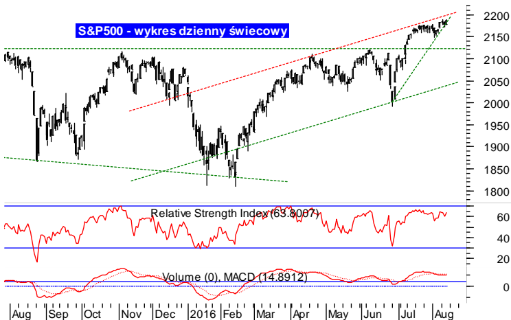
S&P500 - wykres dzienny świecowy

Drugi raz w tym tygodniu zwracają uwagę trudności indeksu sWIG80 z dotrzymaniem kroku barometrom średnich i dużych spółek. Prawdopodobnie ze względu na spore wyciągnięcie indeksów w górę, inwestorzy preferują obecnie aktywa o wysokiej płynności. Równocześnie warto zwrócić uwagę, iż rośnie rynkowy optymizm. Indeks Nastrojów Inwestorów pokazuje, że odsetek inwestorów spodziewających się w ciągu sześciu miesięcy trendu wzrostowego na GPW wzrósł o 3,7 pkt. proc. do 54,8 proc. Odsetek respondentów oczekujących trendu spadkowego spadł z kolei o 0,7 pkt. proc. i wyniósł 25,3 proc. Rosnący optymizm w połączeniu z istotnym przyspieszeniem dynamiki aprecjacji będzie stanowił sygnał do lokalnego przesilenia i krótkoterminowej korekty spadkowej. Indeks sWIG80 wciąż nie przebił się przez opór na 14 tys. pkt.